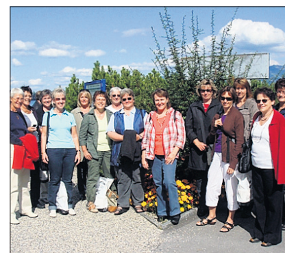
AUF REISEN Die Frauen von vitaswiss waren in der Innerschweiz.